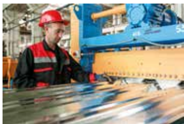
Використовуйте спецодяз та рукавиці (УВАГА! ГОСТРИ КРАЇ)

Неправильні вантажно-розвантажувальні роботи та транспортування призводять до порушення геометрії профільованих листів, пошкодження полімерного покриття та втрати зовнішнього вигляду.