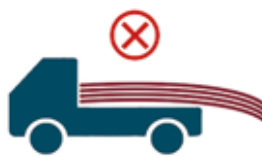
Звисання з кузова > 0.5 м ЗАБОРОНЕНО