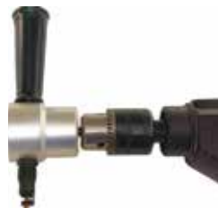
Насадка на дріль