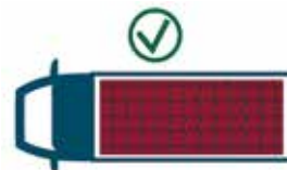
Довжина та ширина кузова має відповідати розмірам продукції