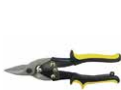
Ножиці по металу