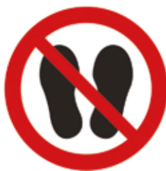
НЕ ХОДИТИ ПО ПРОДУКЦІЇ