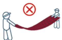
Не допускайте перегинів

Недотримання рекомендацій з транспортування призводить до пошкодження продукції та автотранспорту клієнта.