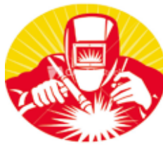
Не допускається проведення зварних робіт поблизу продукції