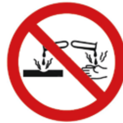
Не допускайте вплив агресивної рідини