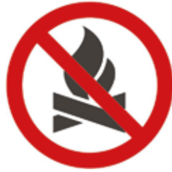
Не допускайте впливу відкритого вогню